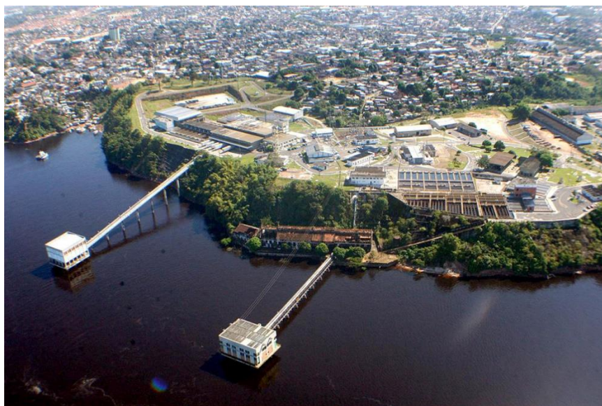
Figura 2 : Estação ETA 1 e ETA 2 da Água de Manaus – Ponta do Ismael